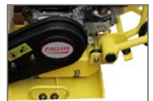
Nytt avvibrerat handtag