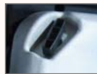
Extra manuell start