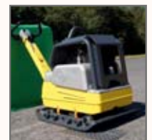
Alltid med elstart i standardutförande