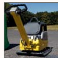
Vibrationsdämpande gummi handtag och steglös servostyrning